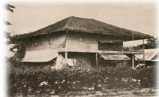
บำรุงวิทยา พ.ศ. ๒๔๕๗

ไปประเทศอังกฤษเพื่อศึกษาต่อทางการศึกษา เพื่อกลับมาดำเนินงานโรงเรียนโดยเฉพาะ (แหม่มเล็ก) ได้ปฏิบัติหน้าที่ทางการเรียนการสอน การปกครอง การเงินและการบัญชี ท่านเป็นผู้จัดการทั้งโรงเรียนบำรุงวิทยา และโรงเรียนสตรีวิทยา ซึ่งท่านรับภาระหนักมาก แต่ก็ปฏิบัติหน้าที่อย่างเต็มความสามารถจนเกษียณและกลับไปประเทศอังกฤษ ในปี 1952 และถึงแก่กรรมในเดือนเมษายน ปี ค.ศ. 1978)