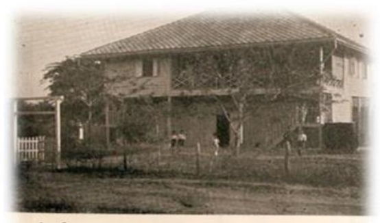
บำรุงวิทยา พ.ศ. ๒๔๖๖

พ.ศ. 2484 ได้ขออนุญาตจัดตั้งโรงเรียนมัธยมหญิงขึ้น โดยแยกมาจากโรงเรียนสตรีวิทยา เมื่อวันที่ 4 มิถุนายน พ.ศ. 2484 ใช้ชื่อว่า “โรงเรียนบำรุงวิทยา 2 ”